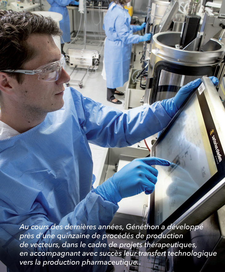
Au cours des dernières années, Généthon a développé près d'une quinzaine de procédés de production de vecteurs, dans le cadre de projets thérapeutiques, en accompagnant avec succès leur transfert technologique vers la production pharmaceutique.