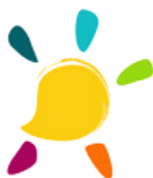
SERVICE DE PRESSE Morbihan EST (56)

06 47 35 19 64 telethon35@afm-telethon.fr