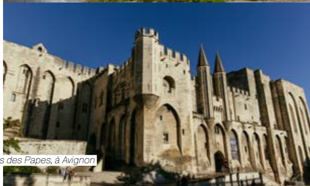
Palais des Papes, à Avignon