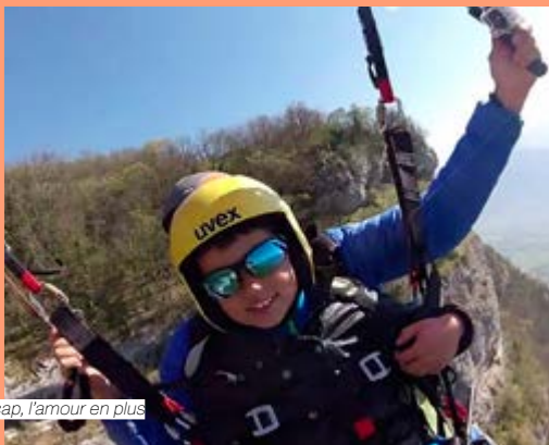
Handicap, l'amour en plus