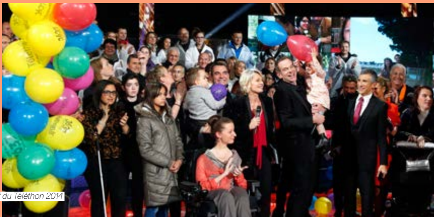
Best of du Téléthon 2014