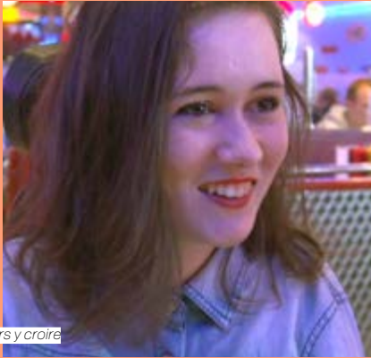
Toujours y croire