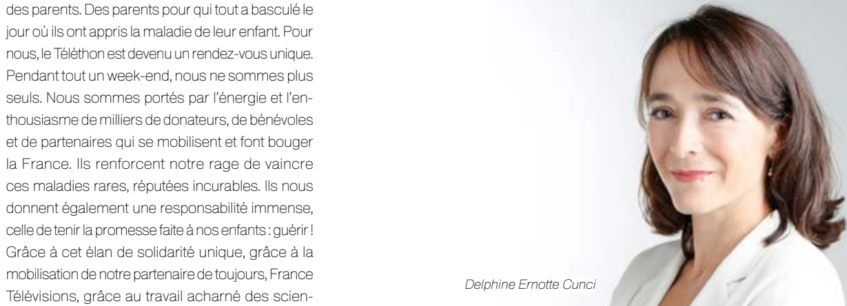
Delphine Ernotte Cunci