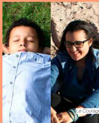
Le Courage avant l'âge