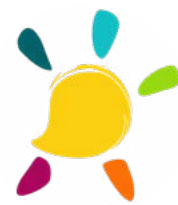
DRÔME NORD (26)

06 30 27 98 15 telethon26s@afm-telethon.fr