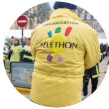
SERVICE DE PRESSE AIN EST (01)

01 69 47 25 64 efoucardtiab@afm-telethon.fr